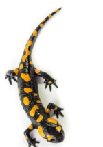
ファイアーサラマンダー