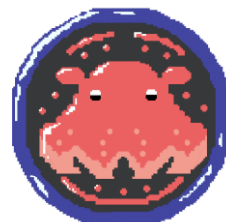
ピンズ（深海勇者の証）