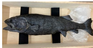
ヨコヅナイワシ（プラスチック標本）

※プラスチック標本…生き物に含まれる水分や脂肪分を合成樹脂に置き換え、細胞組織を生きていた時に近い状態で標本化できる技術