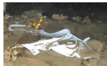
水中ドローンで撮影した深海ゴミ

近年深刻化する海洋プラスチックゴミ問題について解説したパネルを設置します。サンシャイン水族館の水中ドローンで撮影した深海ゴミを放映し、深海に与える影響などをお伝えします。