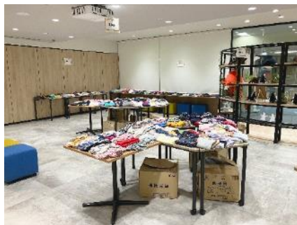
サイズごとに分けられた子ども服