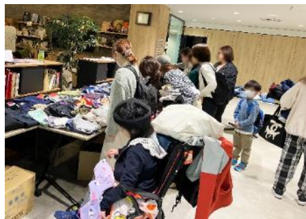
子ども服を選ぶ様子

サンシャインシティでは今後も引き続き、子ども服マーケットの開催や豊島区や地域に関わる企業との連携等を通して、地域の方々とともにまだ着られる子ども服を必要とされる場所へお届けする活動をしてまいります！