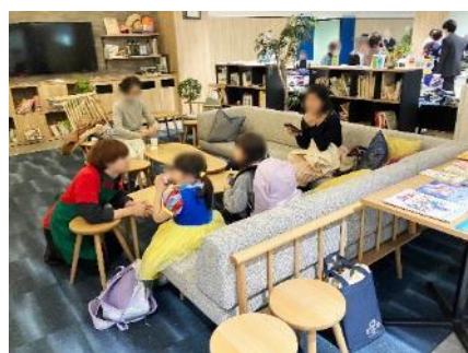
休憩スペースで囲らんするご家族の様子