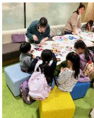
立教大学学生ボランティアの企画コーナー