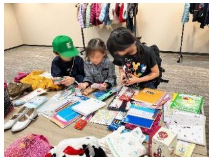
文具を選んでいる様子