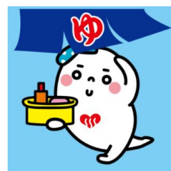
東京都浴場組合公式キャラクター「ゆっぼくん」の クリエイティングや、ゆっぼくんグッズの販売も