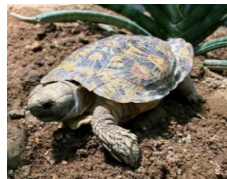
サンシャイン水族館で飼育している バンケーキリクガメ