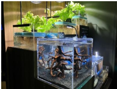
サンシャイン水族館に展示中のアクアポニックス水槽