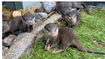
コツメカワウソの赤ちゃん3兄弟 (生後76日目の様子)

➤ コツメカワウソ赤ちゃん3兄弟の愛称決定に向けた一般投票を9月8日まで実施中！ ニュースリリースはこちら