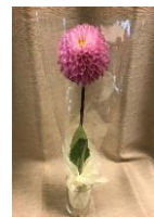
プレゼントするダリアの切り花例