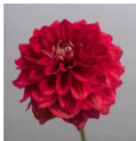
エターニティ サンセット