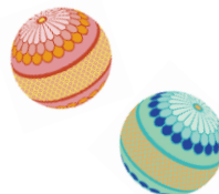
過去の実施の様子