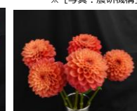
エターニティ サンセット 採花5日後