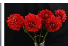
エターニティ サンセット 咲き始め