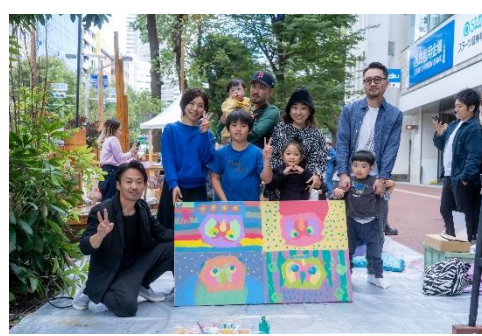
完成したストリートファニチャーは、南入口前広場に設置されます。

※写真はグリーン大通りでのイベントの様子。今回ペイントするファニチャーとは異なります。