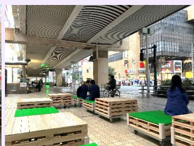
ストリートファニチャー設置後の様子