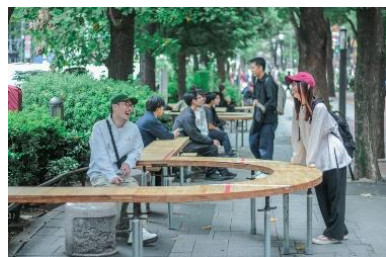
IKEBUKURO PUBLIC FURNITURE TRIAL グリーン大通りの様子

池袋エリア内にストリートファニチャーを設置し、その利用者の回遊行動や属性を調査することで、池袋のまちを更に居心地の良い空間へつなげるための取り組み。池袋内計4か所を皮切りに、個性あふれるファニチャーを設置し、まちを居心地良い空間へと変貌させていきます。