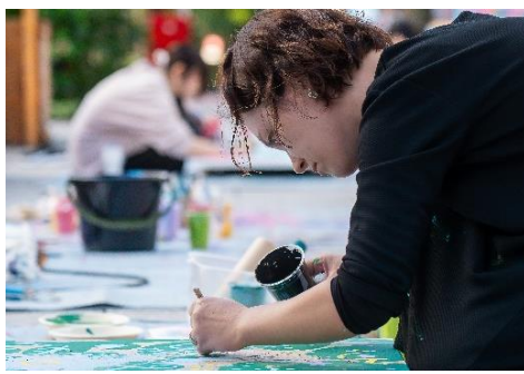
アーティストたちがそれぞれのセンスを活かして仕上げ