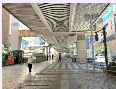
普段の南入口広場の様子

南入口前広場は首都高速道路の高架下にあります。普段は歩行者通路として利用されていますが、通行する方がつい足を止めてしまうような賑やかな空間を目指し、イベントの開催やストリートファニチャーの設置を実施中。余白となりがちな高架下の都市空間を賑わい創出の場として活用しています。