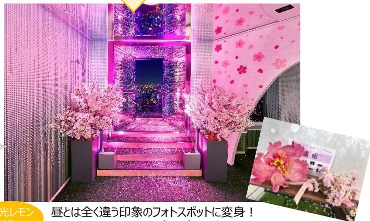
昼とは全く違う印象のフोटスポットに変身！写真映えるフォトプロップスもご用意