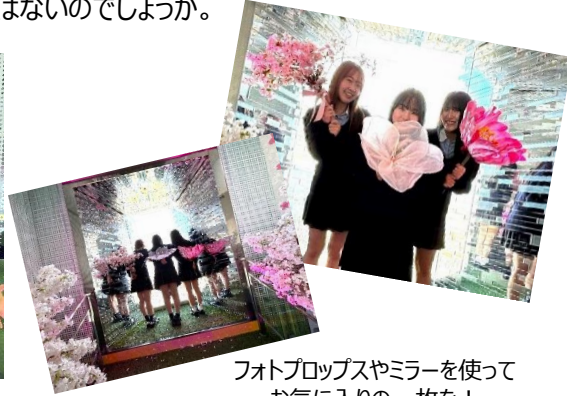
フォトプロップスやミラーを使ってお気に入りの一枚を！