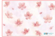
桜柄のレジャーシートは期間限定

てんぼうパーク内のてんぼうパークCAFEでは、「さくらまつり」期間限定のお花見メニューを販売中。昨年大好評だった「さくらいちごミルク」をリニューアルした「てんくういちごオーレ」（600円）や、甘酸っぱいいちごソフトクリームとあんこの甘さがマッチした「花より団子パフェ」（950円）はお団子も乗ってボリューム満点！バスケットに入った「ベーコンエッグサンド」（950円）を買って、無料貸し出ししている桜柄のレジャーシートをてんぼうの丘に広げたら、いつでもお花見ピクニック気分が味わえます。