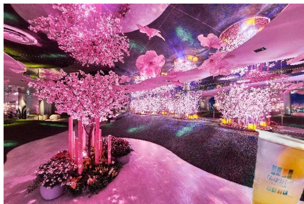
夜は「てんぼうの丘」がピンク色に。夜桜に包まれたような雰囲気の中でほろ酔い気分♪