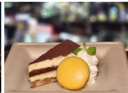
各満月をイメージしたコラボメニュー (2025年1月販売：ウルフムーンティラミス)

スーパームーン：年間で地球に最も近く、見かけ大きく見える満月 マイクロムーン：年間で地球から最も遠く離れ、見かけ小さく見える満月 出典：tenki.jp | 日本気象協会「マイクロムーンとは？スーパームーンとの違いや各月の満月の呼び名も解説」 ( https://tenki.jp/suppli/gureweather_46/2025/03/13/32619.html )