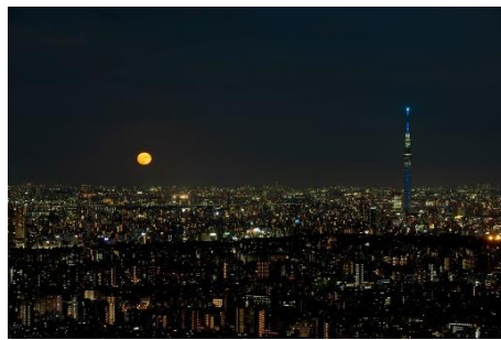
てんぼうパークから見る景色

一例として、6月の満月は苺の収穫をする時期の満月であるので、「ストロベリームーン」と呼ばれています。