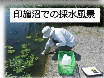
印旛沼での採水風景