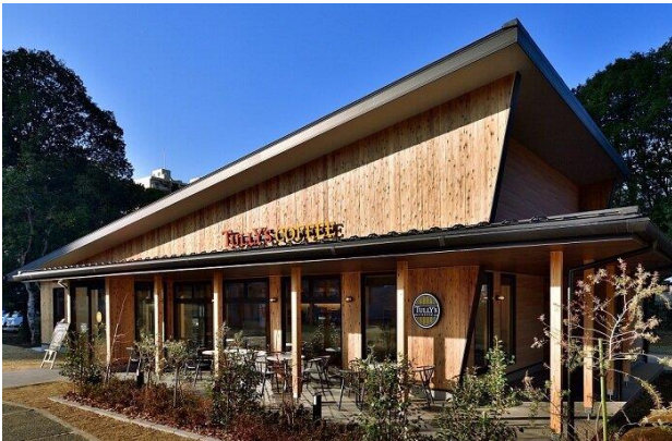
【タリーズコーヒー ロースター相模大野中央公園店】

「相模大野みんなの協議会」は、「プラウドタワー相模大野クロス」の開発事業者である野村不動産株式会社、オーノクロス広場の運営事業者となる JCOM 株式会社、相模大野中央公園内に設置したカフェ運営事業者であるタリーズコーヒー・ジャパン株式会社の 3 社が中心となり、活動しています。相模大野駅周辺からプラウドタワー相模大野クロス敷地内のオーノクロス広場・相模大野中央公園まで連続したにぎわい軸を形成することを目標とし、駅・商業施設・公園など点在する資源を面的につなぎ、官民・地域が連携したエリアマネジメントを推進することで、相模大野駅周辺全体の価値向上を目指すものです。（本協議会の活動について： https://onomin.jp/ ）