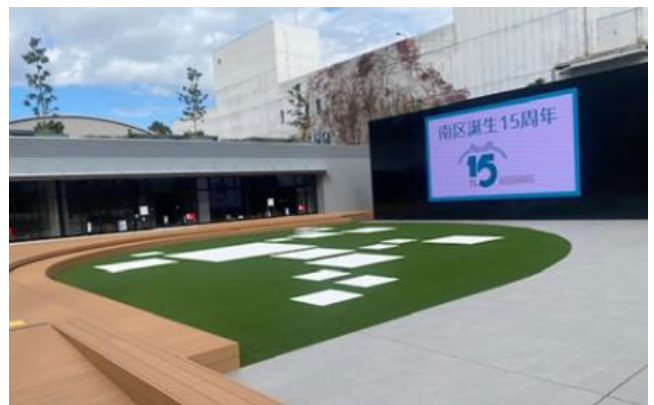
【公共広場（オーノクロス広場）】