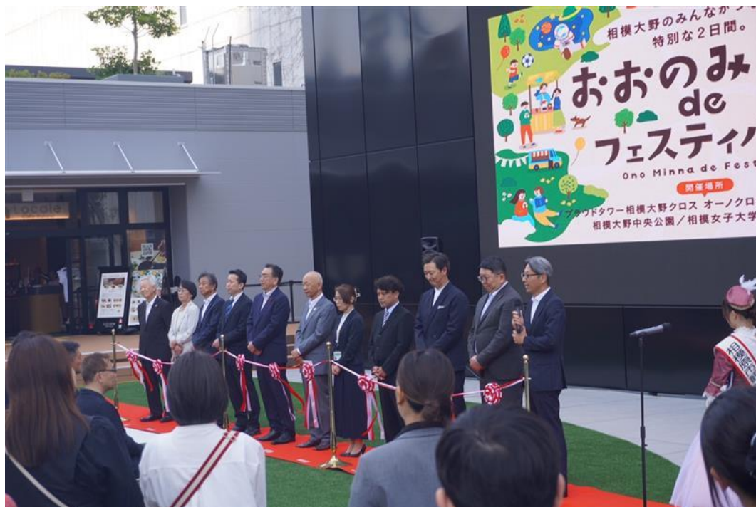
【テープカットセレモニーの様子】

このたび2026年5月15日（金）・16日（土）の2日間、相模大野駅周辺一帯にて回遊型まちびらきイベントとして「おおのみんな de フェスティバル」を開催したことをお知らせいたします。