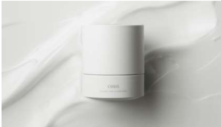
『オルビス オフクリーム』100g 2,300円（税込 2,530円）

※ 1 こわばった肌にうるおいを与え、柔らかくすること、そのこちよさを感じること。