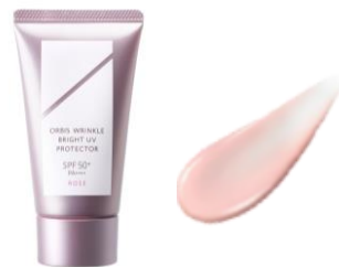
『オルビス リンクルブライト UV プロテクター N ローズ』 50g 3,500円(税込 3,850円)