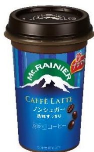
マウントレーニア カフェラッテ ノンシュガー

独自技術の新アロマ製法により引き出されたエスプレッソのコクと香り、ほろ苦くほろ甘いビター感をお楽しみください。