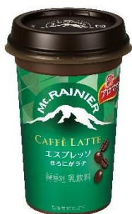
マウントレーニア カフェラッテ エスプレッソ

独自技術の新アロマ製法により引き出されたエスプレッソのコクと香り、ほろ苦くほろ甘いビター感をお楽しみください。