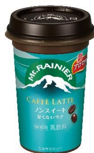
マウントレーニア カフェラッテ ノンスイート

独自技術の新アロマ製法により引き出されたエスプレッソのコクに、ミルクを加えたノンシュガータイプ。後味すっきりのお楽しみください。