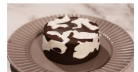
〈Variche 底面から見た写真〉