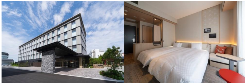
※お部屋のイメージ: モデレートツイン

詳細はこちらから( https://www.m-inuyama-h.co.jp )