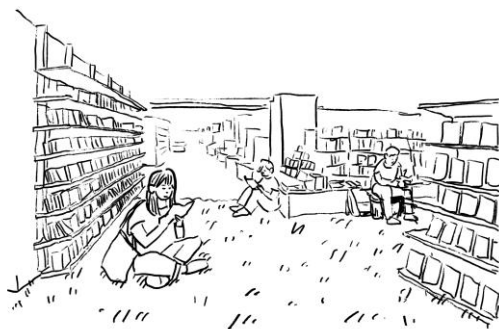
「本屋に芝生！？本パーク」イメージ