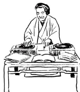
「現代転生！？文豪 DJ ナイト」イメージ