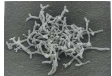
Bifidobacterium longum BB536

世界保健機関(WHO)によると、下痢や感染症などの疾患による、5 歳未満の幼児の死亡数は毎年約 520 万人にも上ることが報告されています。全体的には減少傾向にありますが、地域格差はますます広がってきており、地域によっては、逆に死亡率が増加傾向にあることも事実です。また、保育園や託児所などに通う幼児は、自宅での保育と比較して、感染症にかかるリスクが 2 倍から 3 倍になるとの報告もあり、家族や社会への経済的な負担拡大につながり、世界的に問題となっています。