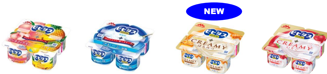
※左から ビヒダス ヨーグルト ピーチミックス+パイン 4ポット(75g×4) / ビヒダス ヨーグルト プレーン 加糖 4ポット(75g×4) / クリーミー ビヒダス ヨーグルト CREAMY はちみつ 4ポット(75g×4) / ビヒダス ヨーグルト CREAMY いちご 4ポット(75g×4)