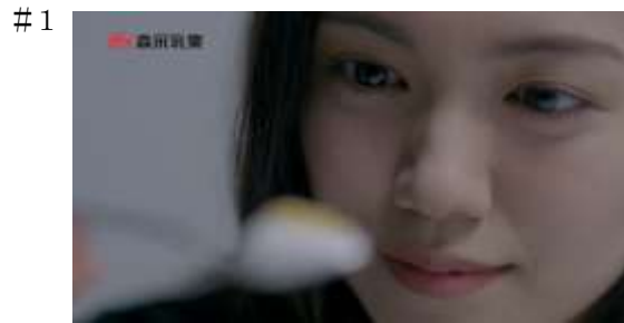
(二階堂さん)パルテノは、