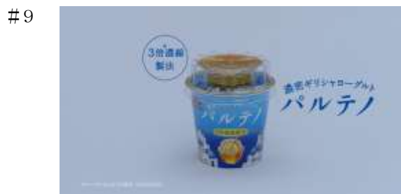
濃密ギリシャヨーグルト パルテノ