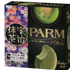
PARM(パルム) 抹茶(6本入り)