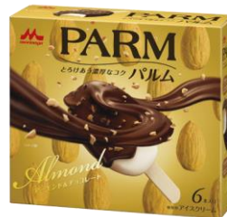
PARM(パルム) アーモンド&チョコレート (6本入り)