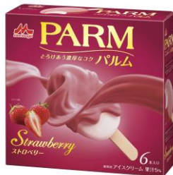
PARM(パルム) ストロベリー (6本入り)