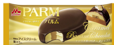
PARM(パルム) キャラメル・バナナスショコ(1本入り)