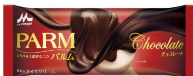
PARM(パルム) チョコレート(1本入り)