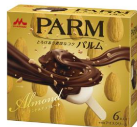
PARM(パルム) アーモンド&チョコレート (6本入り)