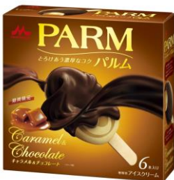
PARM(パルム) キャラメル & チョコレート (6本入り)