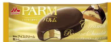
PARM(パルム) キャラメル・バナナチョコ(1本入り)