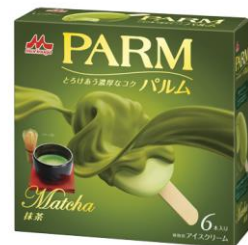
PARM(パルム) 抹茶(6本入り)