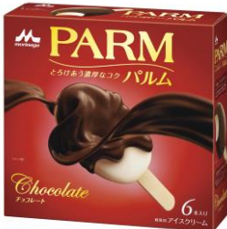
PARM(パルム) チョコレート(6本入り)