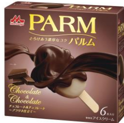
PARM(パルム) チョコレート&チョコレート ~プラリネ仕立て~ (6本入り)