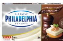
フィラデルフィア クリームチーズ 6P ブラックペッパー