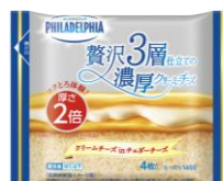
フィラデルフィア 贅沢3層仕立ての濃厚クリーミーチーズ