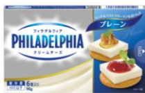
フィラデルフィア クリームチーズ 6P プレーン