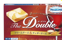
フィラデルフィア The Double 6P (クリームチーズ&チェダーチーズ)