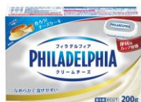
フィラデルフィア クリームチーズ