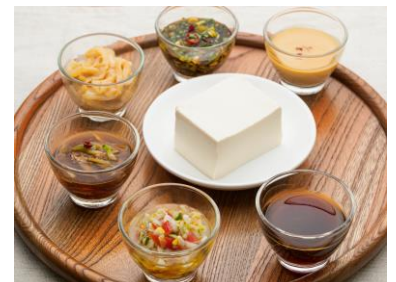
▲「森永 絹とうふ」に合う! 秘伝のタレ レシピ

南極料理人としておなじみの料理家、西村淳氏が考案した「森永とうふ」シリーズの秘伝レシピを公開いたします。「森永 絹とうふ」のなめらかさを感じていただけるレシピや、「森永 絹とうふしっかり」のしっかりとした硬さを活かしたレシピなど、全 12 種類を 9 月 28 日(火)より、「森永とうふ」シリーズのブランドサイトにて順次公開いたします。ぜひ、新しくなった「森永とうふ」シリーズを、プロ考案のメニューでお楽しみください。