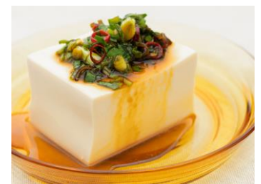
▲ボリューム満点! ニラの冷奴ダレ