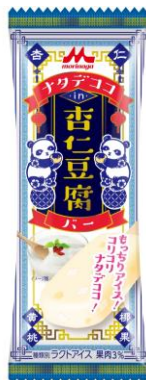
「ナタデココ in 杏仁豆腐バー」 140円(税別)