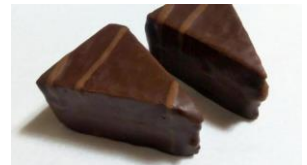
三角形のケーキ型のチョコレートのイメージ

以来、森永乳業はチーズデザートのパイオニアとしてさまざまな商品を発売してきました。