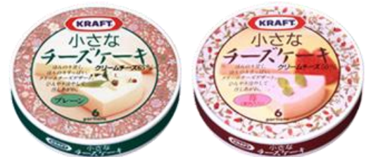
1992年3月 小さなチーズケーキ プレーン/苺(果肉入り)を発売