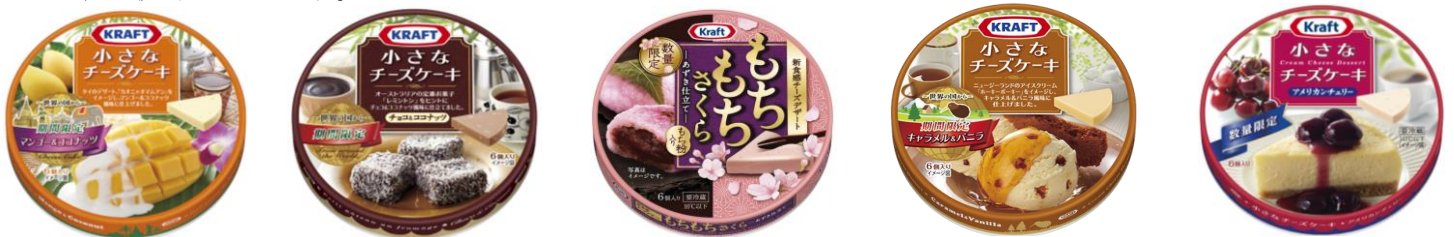
※現在はすべて販売を終了しています

お店の売り場で目を引くデザインや、思わず食べてみたくなる鮮度感のあるフレーバーが多いことも、市場の伸長を後押ししています。