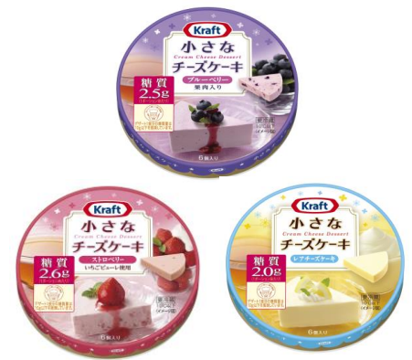
クラフト 小さなチーズケーキシリーズ