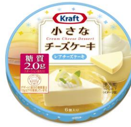
レアチーズケーキ