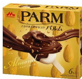
PARM(パルム) アーモンド&チョコレート (6本入り)