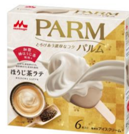
PARM(パルム) ほうじ茶ラテ(6本入り)