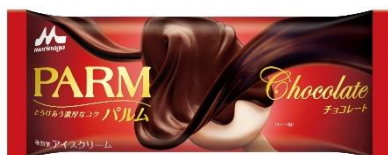
PARM(パルム) チョコレート(1本入り)