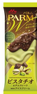
PARM(パルム)ダブルチョコ ピスタチオ&チョコレート(1本入り)