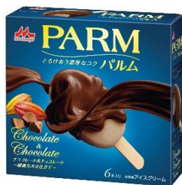
PARM(パルム) チョコレート&チョコレート ~厳選カカオ仕立て~(6本入り)