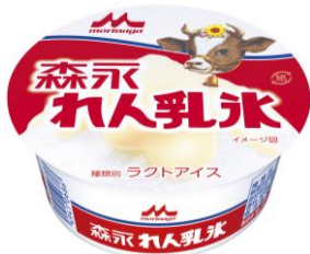
「森永 れん乳氷」140円(税別)