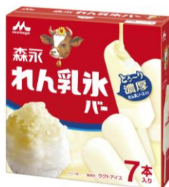
「森永 れん乳氷バー(7本入り)」 オープン価格