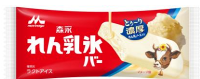
「森永 れん乳氷バー(1本入り)」 140円(税別)