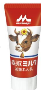
「森永ミルク 加糖れん乳」 190円(税別)