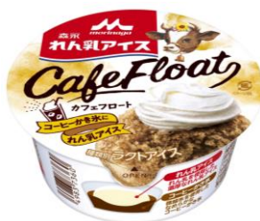
「森永 れん乳アイス カフェフロート/メロンソーダフロート」140円(税別)