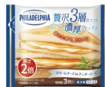
フィラデルフィア 贅沢3層仕立ての濃厚クリーミーチーズ