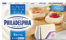
フィラデルフィア クリームチーズ 6P プレーン/香ばしオニオン