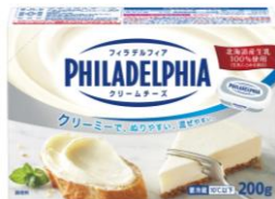
フィラデルフィア クリームチーズ 200g