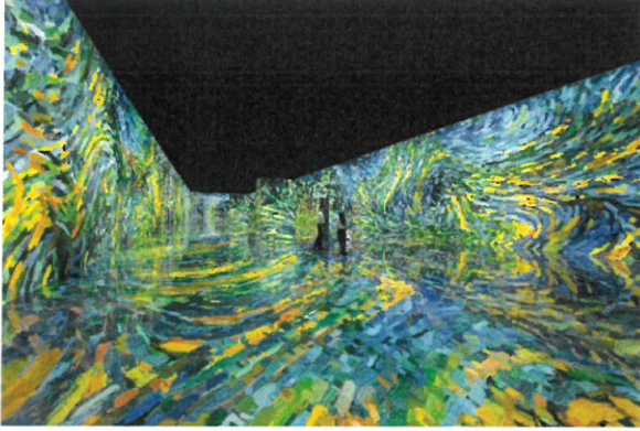
▲GARDEN 'D'ORSAY (GANGNEUNG, NEW YORK)