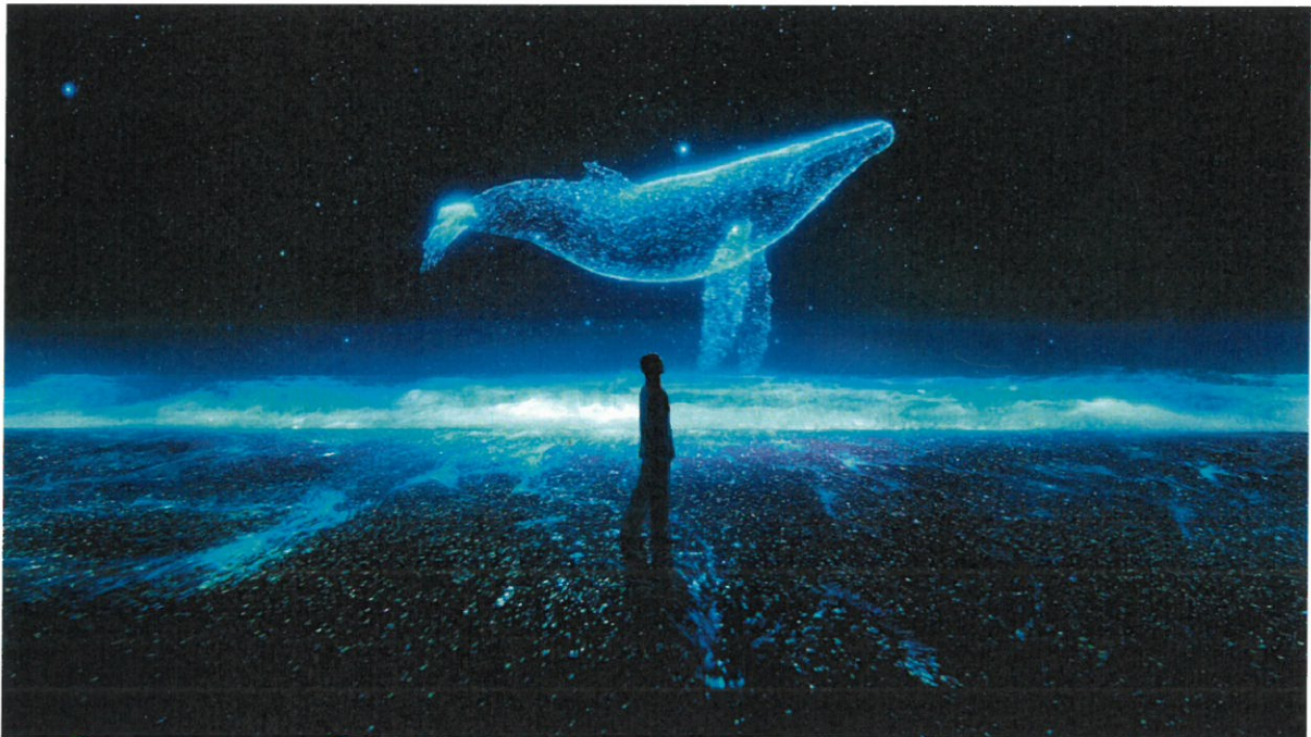
▲ BEACH NIGHT BEING (NEW YORK)

また直近では、本年韓国ボーイズグループのBTSとのコラボレーションを実現し、音楽界の新たな没入体験の取り組みでも世界中に名を広めています。