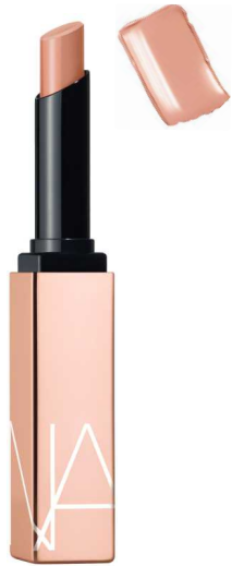
BREATHELESS [品番] 200 ピンクヌード *セミセルフ一部店舗取り扱いなし

ひと塗りで、輝きをオン。際立つ艶やかな新フォーミュラで、周りを圧倒して。 発色とリップケアをハイブリッドに叶えたNARSの最新リップ「アフターグロー センシュアルシャイン リップスティック」は、ひと塗りで唇に立体的な輝きとうるおいを与え、長時間美しい仕上がりをキープします。 シェードのラインナップは、NARSのアイコンックシェード“ORGASM(オーガズム)”や、“DOLCE VITA(ドルチェヴィータ)”を含む、ヌード、ピンク、レッド、ベリーなど全10色展開。今までのアフターグローシリーズにも採用されている、唇に潤いを与えるNARS独自のフォーミュラ、モノイハイドレイトングコンプレックス*配合でスムーズに伸びる心地よいテクスチャーを実現しました。また、マンゴバター(マンゴー種子脂)(エモリエント)が乾燥した唇をなめらかに整え、シアバター(シア脂)(保湿)がうるおいを保つように開発された新処方、グロー・トゥ・リップフォーミュラを新たに採用し、べたつかず軽いつけ心地を叶え、ふっくらとした印象に仕上げます。*ガーデニアタイテンシス花エキス、ヤシ油 光沢感のあるカラーは、重ね付けも自由自在で、シアーからミディアムの発色で、唇を心地よく包み込むように彩ります。「つや」の再定義。今までに見たことのない美しさとし心地よさ。 #GlowSoSweet