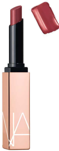
TURNED ON [品番] 321 ベリーレッド