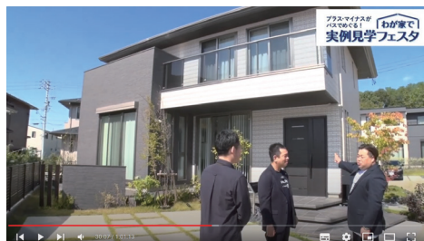
プラス・マイナスがバスでめぐる! わが家で実例見学フェスタ