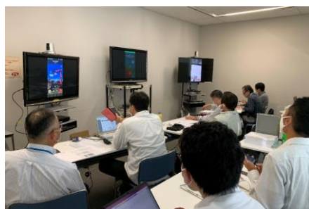
日本からリモートで 建築技術指導を行う様子