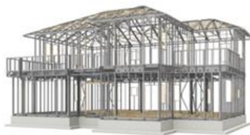
大型パネル構造イメージ図

当社独自の大型パネル構造は、戸建住宅や賃貸住宅向け構法で、外壁や床、屋根などのパネルを強靱なボルトとジョイント金具で一体化させた、強固なブロック体です。構造体全体で荷重をしっかりと受け止める、いわゆる「モノコック構造」となっています。地震や台風などの外力を面全体で受け止め、建物全体にバランスよく分散し、優れた耐震性を発揮します。90 cmモジュール設計で、あらかじめ工場ですッシや換気口まで組み込まれた外壁などの大型部材を建築現場に搬入。クレーンなどで正確・迅速に組み立てることで、建築現場での省力化を実現します。