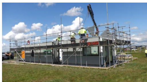
現地での試作棟上棟工事の様子

2020年7月に当社湖東工場(滋賀県)から出荷した住宅部材は、名古屋から船便で約1ヵ月後の8月末にニュージーランドへ到着しました。試作棟の建築は、当初、当社社員による現地での技術指導を予定していましたが、ニュージーランド政府による入国規制の下、リモートでの建築技術指導へ方針を転換しました。日本から現地への通信手段は、映像だけでなく、資料共有や画面上に直接文字などを描けるスマートフォン用リモートガイダンスアプリ、XMReality(XMReality AB社製)を採用しました。リモートでの試作棟の上棟工事は、3日間にわたり実施。工事は、現地担当者と日本の技術指導者をそれぞれ、準備、工事、検査・修正の3グループに分け、各工程別にアプリを通じて、建設現場の様子をリアルに画面共有しながら、工事を推進しました。MGC社においても当社の住宅部材での建築は初めての取り組みでしたが、計画通りに上棟工事を完了。10月には、当社の取り組みに賛同したニュージーランド政府発行の特別入国ビザで当社社員が現地入りし、中間検査における施工品質に問題がないことを確認しました。