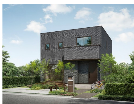
『V'esse』外観バリエーション例