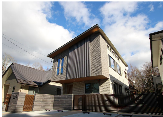
総合デザインコース 最優秀賞事例 外観 [設計:パナソニック ホームズ埼玉西(株)]

今回選出された優秀事例に対する審査員の概評は、オーナー様の住まいに対する思いを引き出して具現化できているか、オーナー様の期待を超えるアイデアや魅力付けができているかが、評価のポイントとなりました。