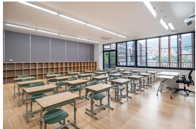
普通教室:机・椅子の納入に加え、建物に合わせたランドセルロッカーの設計・施工(造作家具)