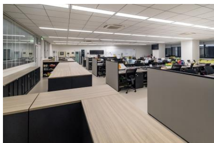
職員室:児童生徒が入れるエリアを視認させる棚(既製家具)