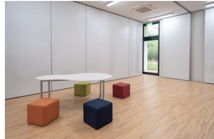
オープンスペース:学習内容に合わせて、廊下も学習スペースとして活用(既製家具)