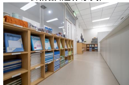
事務室:商品数と現場寸法に合わせた購買棚(造作家具)