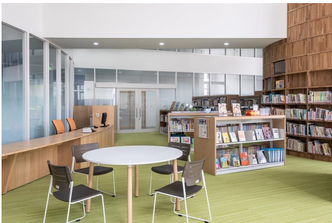
メディアセンター:空間に広がりをもたらし、蔵書数を考慮した、棚の選定(既製家具)