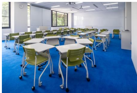
アクティブラーニング:学習方法に合わせて可動式家具(既製家具)