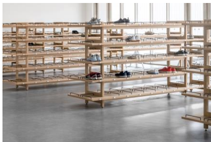
下足棚:壁をつくらず目線が通る明るいづくり (造作家具)