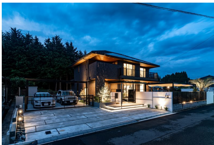
総合デザインコース 最優秀賞事例 外観 [設計:パナソニック ホームズ大分(株)]

今回選出された優秀事例に対する審査員の概評は、オーナー様の住まいに対する思いを引き出して具現化できているか、オーナー様の期待を超えるアイデアや魅力付けができているかが、評価のポイントとなりました。