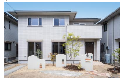
『ReVALUED』買取再販住宅 第1号モデルハウス

『ReVALUED』の買取再販住宅の展開にあたり、実物件第1号となる販売用モデルハウスが滋賀県草津市にオープンしました。同モデルハウスは、当社の分譲住宅団地『スマートシティ草津』(2013年街びらき)内にある築11年の戸建住宅「スムストック物件」です。内装・建具等を全てリフォームしているほか、『リフォーム用全館空調』も設置し、『ReVALUED』の買取再販住宅の魅力を体感できます。