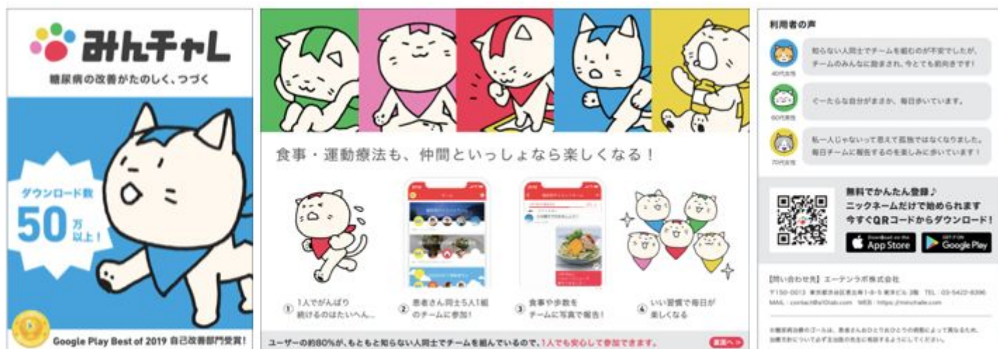
患者さん向け「みんなチャレ」紹介用パンフレット

【ご登録申請フォーム】 https://forms.gle/db9cSZhLA5dCb4Rj7