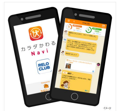
▲Relo健康サポートアプリ

「Relo 健康サポートアプリ」では従業員に向けて、食事・運動・睡眠などの毎日の生活を専属 AI アシスタントが全力サポート。ダイエット、メタボ対策など、AI アシスタントが食事・運動の面から具体的で実践的なアドバイスを日々、提供します。従業員の健康活動(ライフログ)は簡単にグラフ表示でき、健康管理の可視化も容易です。