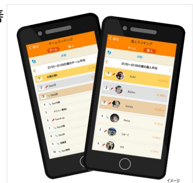
▲Relo健康サポートアプリによるランキング表示

アプリを通じて従業員の生活習慣を見える化し、健康づくりのPDCAが円滑に回る上に、従業員一人一人の生活習慣に合った AI アシスタントによる日々の健康アドバイスは、離脱を防止し意識改善を無理なく進めることができ「健康経営」への近道ともなります。