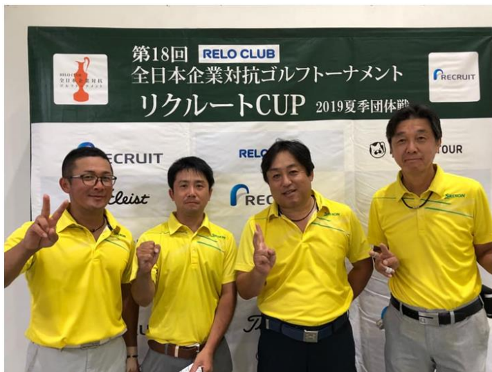
▲優勝した株式会社豊後プロパン「チームクリーンビー」

福利厚生アウトソーシングサービスのトップカンパニーである株式会社リロクラブ（東京都新宿区、代表取締役社長 杉山 新吾）が主催する日本最大級の企業対抗ゴルフトーナメント“RELO CLUB 第18回全日本企業対抗ゴルフトーナメント「リクルート CUP 2019 夏季団体戦」”の全国決勝大会が9月23日、茨城県行方市のセントラルゴルフクラブ（東コース 6777 ヤード、西コース）6666／パー72にて開催されました。今回は、東西の36ホールを使用し、過去最大規模の84チーム（336名）による全国決勝大会となりました。結果は、連覇が難しい団体戦で九州から参戦した株式会社豊後プロパン（チームクリーンビー）が、競合ひしめく夏季団体戦の猛者を退け、春夏連覇を果たしました。