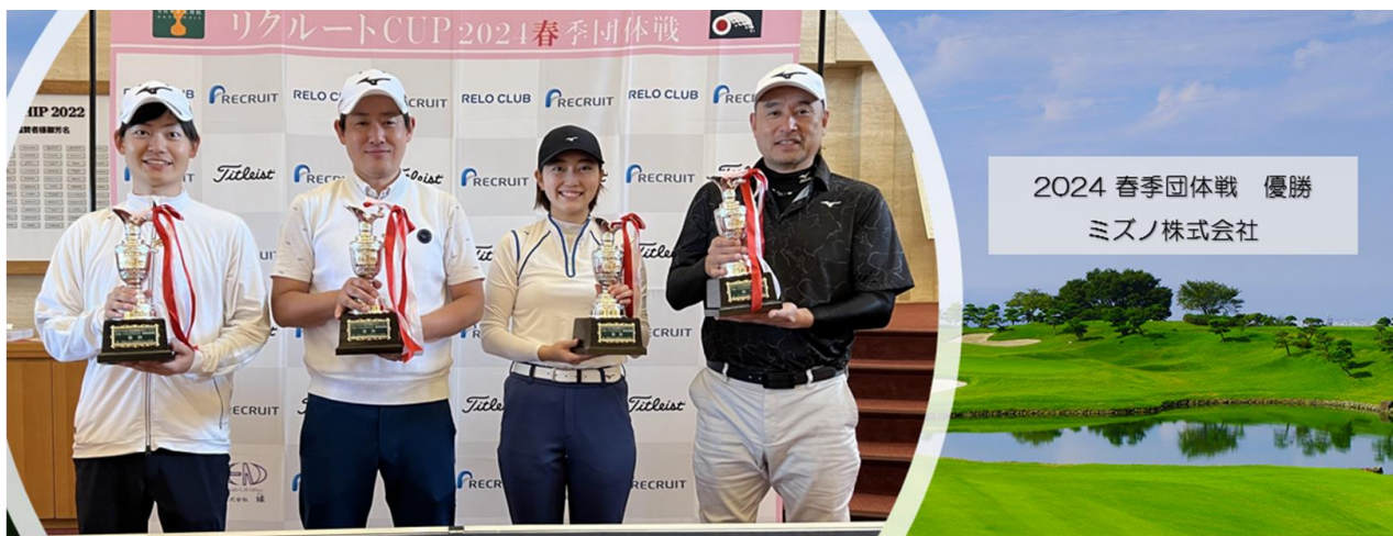
▲優勝したミズノ株式会社（チーム名：ミズノ）の皆さん

大会当日は小雨ぱらつく天気となりましたが、暑すぎず比較的ラウンドしやすいと思われる気温の中での全国決勝大会となりました。全国決勝大会に勝ち残った36チーム（144名）は、どのチームが優勝するかかわからないほど強豪チームがひしめく中、初出場のミズノ株式会社が221の好スコアで見事初優勝を果たされました。