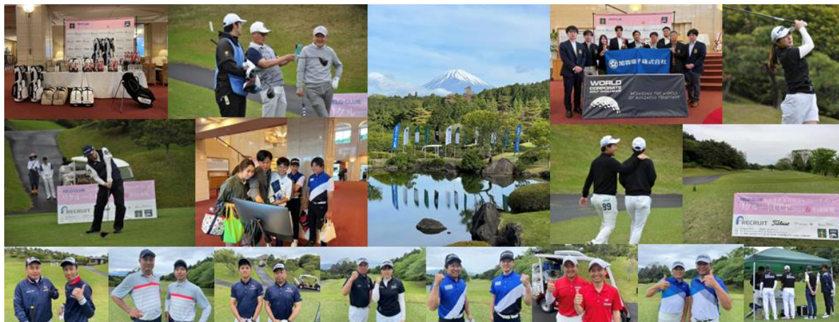
▲春季団体戦2024の様子

ールとして、年齢・性別に関係なく社内外で活用することを期待しております。そして、本大会を通じて生まれる有意義なひとときが、友情、連帯感、フェアプレイの精神を育み、運動不足解消、健康増進と生涯スポーツのさらなる充実に貢献し、企業が目指す健康経営 ※2 の支援につながるよう、これからも努めてまいります。