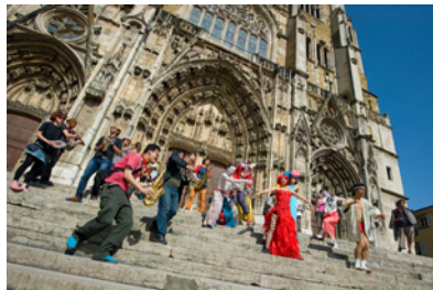
渋さ知らズオーケストラ