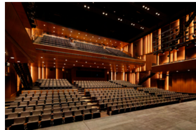
ロームシアター京都 サウスホール