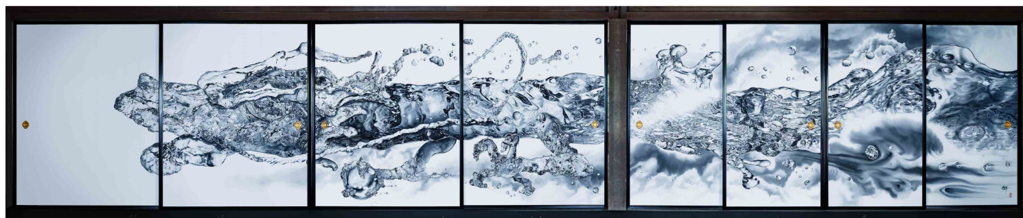
作品右側の嵐は現在の困難な社会情勢（コロナや紛争）を表現し、一方で、作品左側の空白は光を表しています。これは「全人類が明るい未来へ向かうように」という作者の願いを込めています。この模絵は、永続的に年に一回公開される予定 100年、200年と受け継がれることでしょう。