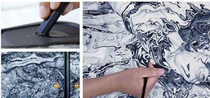
本作は、日本の伝統的な書道具を使用し、約10mに渡り緻密な描写を重ねて描かれています。