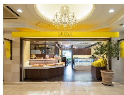
ル・パン神戸北野 和泉府中店