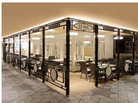
ル・パン神戸北野 伊丹空港店