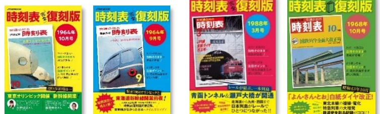
↑第1～4弾も好評発売中