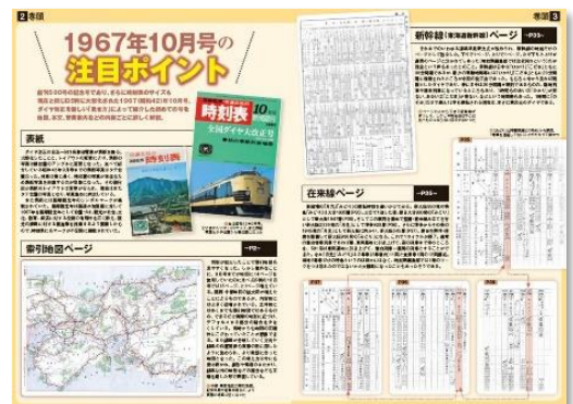
↑巻頭の解説ページ