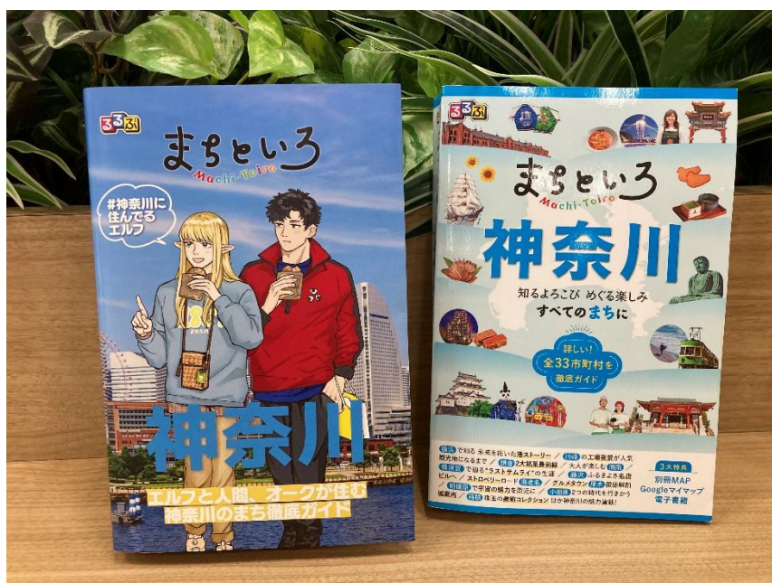
▲今回発売される書泉限定のコラボブックカバーバージョンの 『るるぶ まちという神奈川』（左）