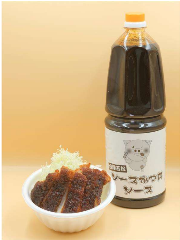
▲「会津名物！特製ソースカツ丼」700円