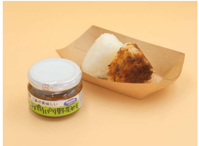
▲「会津の恵み！香ばし味噌焼きおにぎり」300円

＜お問い合わせ先＞ JTBパブリッシング ブランド戦略室 メール：pr-team@rurubu.ne.jp