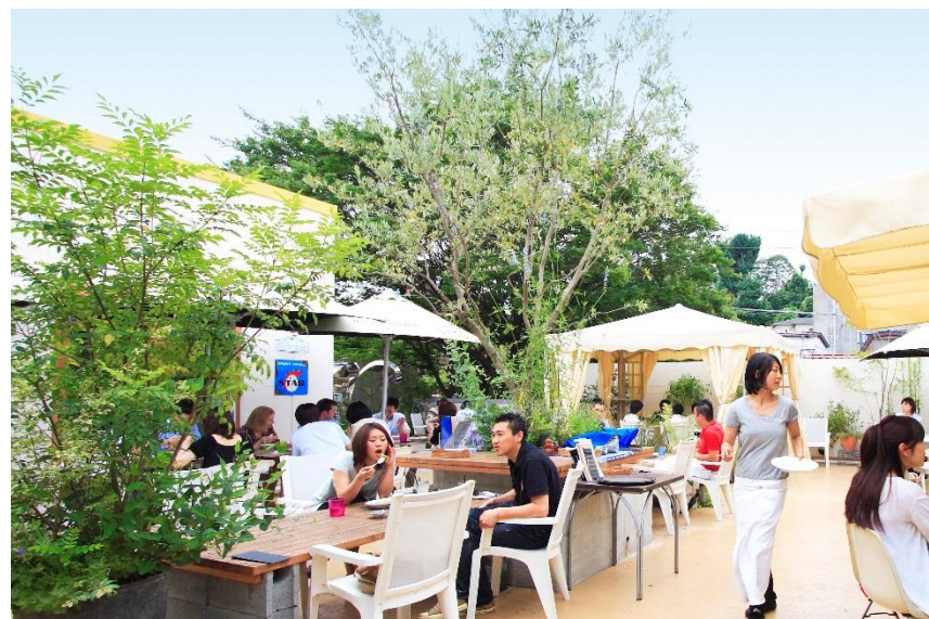
※イメージ写真です。