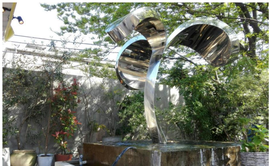
※噴水イメージ写真です。

入口から一步足を踏み入ると約80席の緑溢れるガーデンテラスが広がり、噴水から流れる水の音が寛ぎ空間を演出。