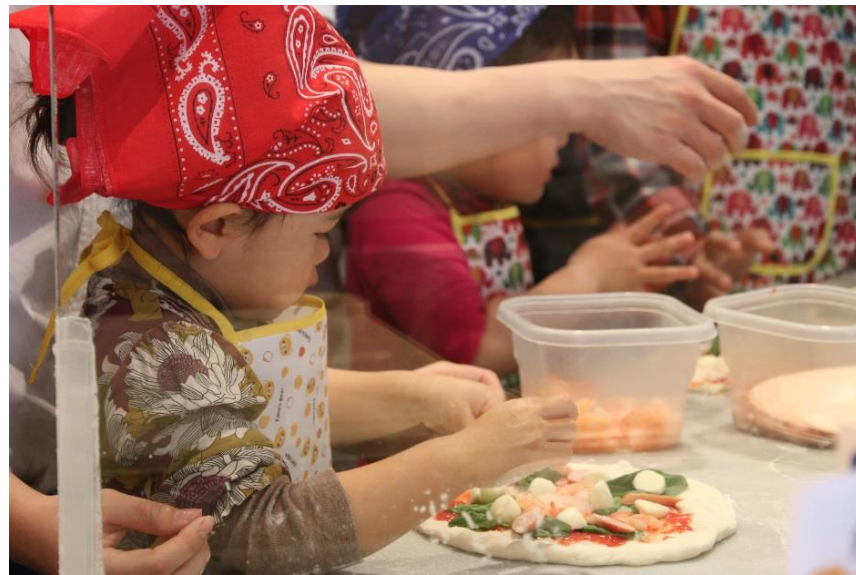
▲ピッツア作り教室