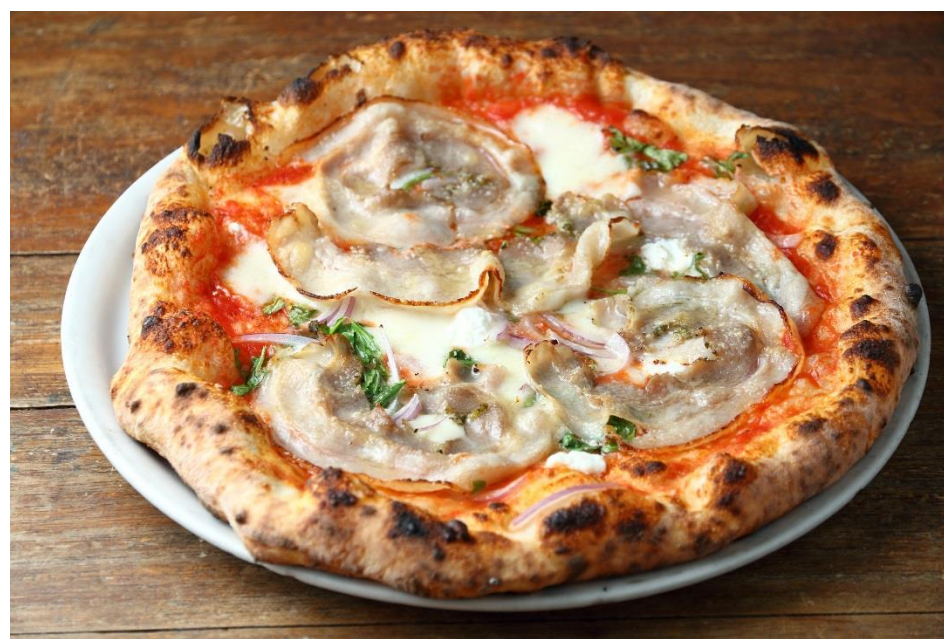
▲ポルケッタ ロッソ ¥1,400 (税別)