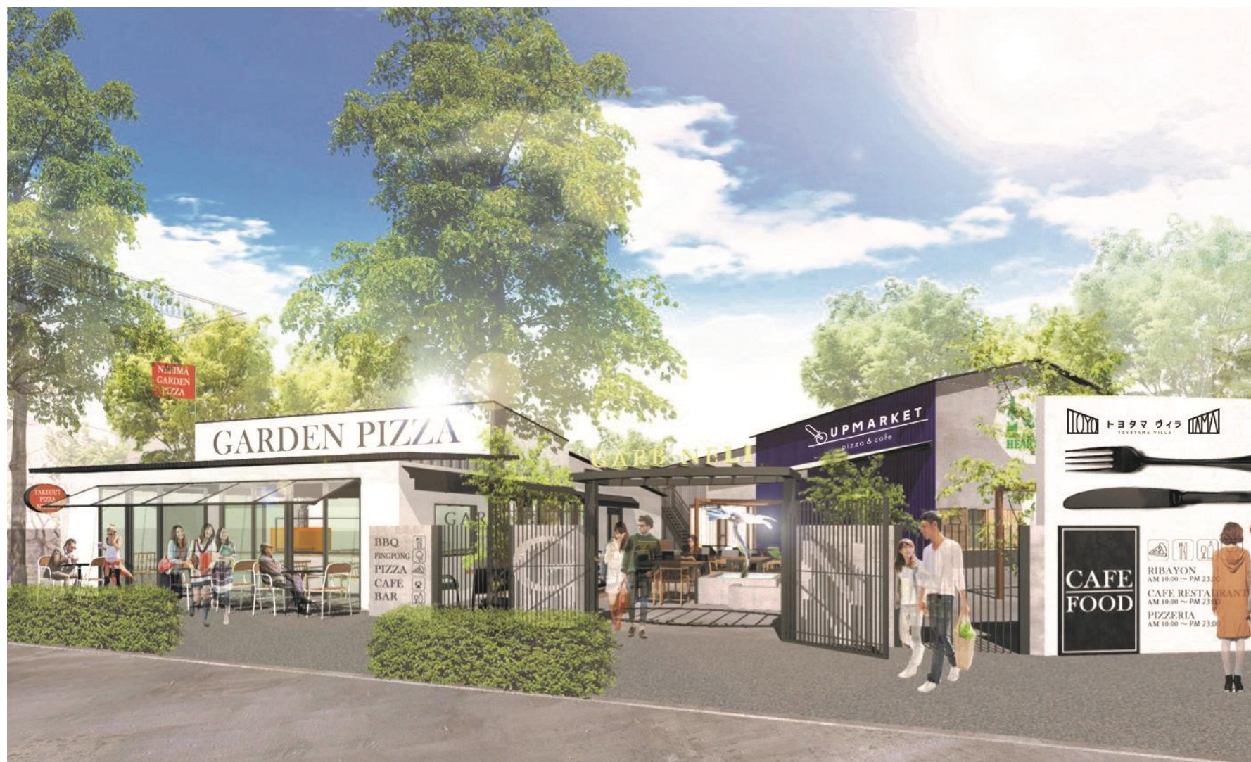
※イメージパースです。

入口から一步入ると緑溢れるガーデンテラスが広がり、静かでゆったりとした空気が流れるヴィラをイメージをした「トヨタマ ヴィラ」。中には「アップマーケット ピッツァ&カフェ」がオープン。薪窯で焼く本格ナポリピッツァを軸としたイタリアン中心のランチ・ディナーメニューに加え、テラスでBBQ、ピッツァ作り教室やマルシェなど、食を通じて老若男女問わず、地域の方々と共に作り上げていくイベントやコンテンツを随時開催予定！