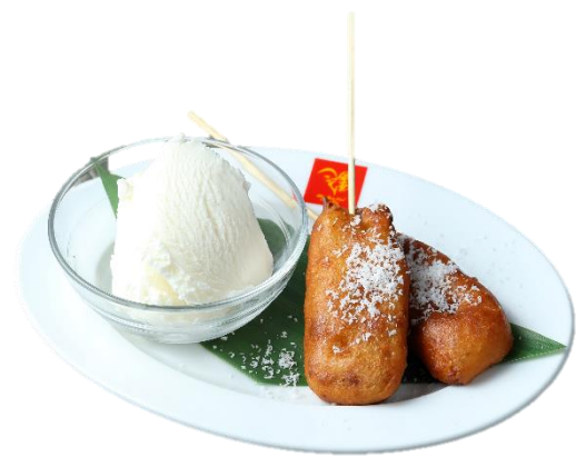
ピサンゴレン-揚バナナとアイス