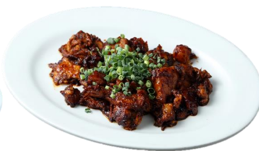
キャロットケーキ