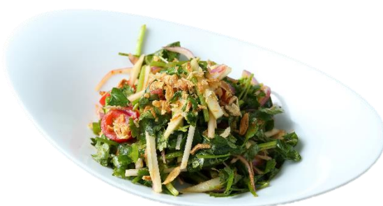
他 パクチーと青パパイヤのサラダ