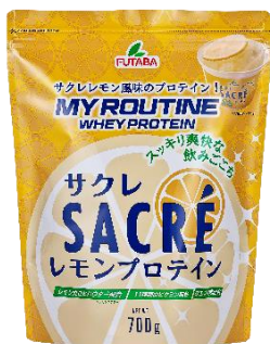
マイルーティーン サクレレモン風味プロテイン