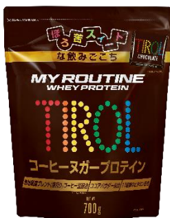
マイルーティーン チロルチョコ コーヒーヌガー風味プロテイン