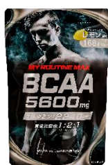
マイルーティーン MAX BCAA5600