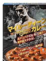
マイルーティーン カレー 中辛