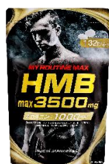
マイルーティーン MAX HMBmax3500